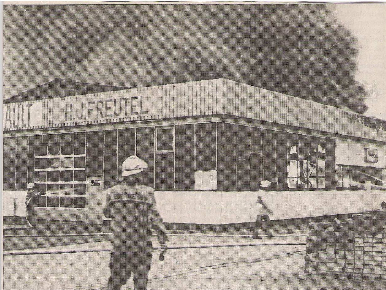
Mehrere Kilometer weit war der dichte Rauch zu sehen: Ein Kfz-Betrieb in Übach wurde am Dienstag abend ein Raub der Flammen.