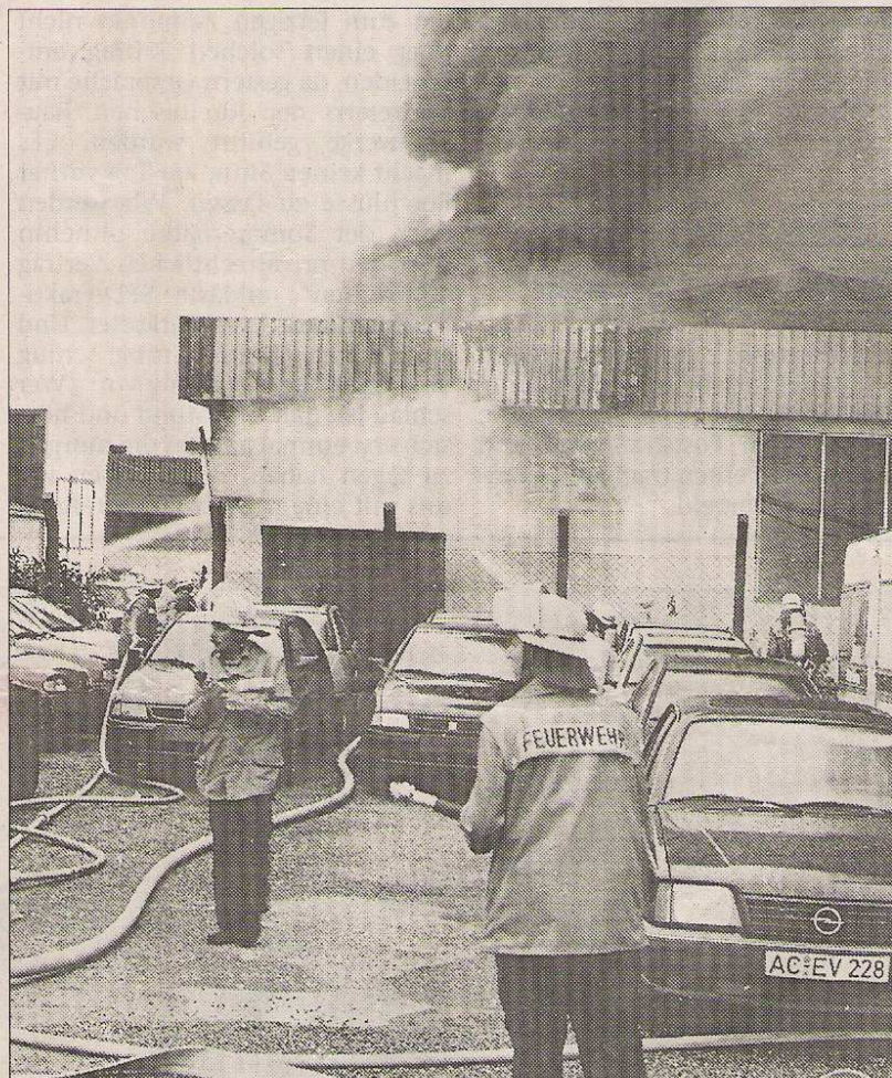
Vor dem Autohaus standen zahlreiche Pkw, die von den Männern der Feuerwehren beiseite geschoben wurden, um die Löscharbeiten auch vor

Diesmal liegt der gesamte Betrieb in Schutt und Asche und die Angestellten stehen erst einmal ohne Arbeit da. Der Eigentümer des Gebäudes stellt dem Kfz-Meister kurzfristig eine Ersatzhalle zur Verfügung, denn der Neuaufbau kann sechs Monate dauern. Den Flammen fielen auch wertvolle Maschinen und mehrere Fahrzeuge in der